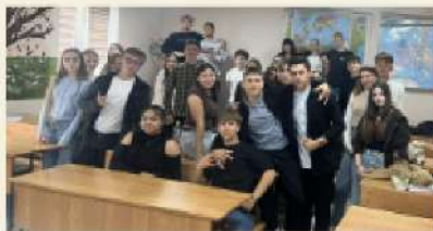
Elevii grupei JUR 251, Colegiul Național de Comerț al ASEM

Nu e mereu ușor – temele, dorul de casă și ritmul alert vin cu provocările lor –, dar entuziasmul și oportunitățile de aici fac totul să merite. Iar cei care doresc să-și continue studiile aici, le pot spune un singur lucru: pașiți cu încredere și cu inima deschisă, pentru că la CNC ASEM veți găsi nu doar un loc unde să învățați, ci și un spațiu unde să creșteți, să râdeți și să adunați amintiri de neuitat.